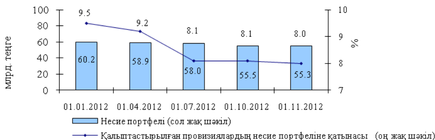
Ипотечалық ұйымдардың несие портфелінің өзгеру динамикасы (млрд. теңгемен)

Міндеттемелер. Ипотечалық ұйымдар міндеттемелерінің жиынтық мөлшері 2012 жылдың басындағы деректермен салыстырғанда 4,5 млрд. теңгеге немесе 5,6%-ға ұлғайып және 2012 жылғы 1 қарашадағы жағдай бойынша 84,2 млрд. теңгені құрады. Бұл ретте, ипотечалық ұйымдардың міндеттемелері құрылымында айналысқа шығарылған бағалы қағаздар (69,1%-ға) басым болды.